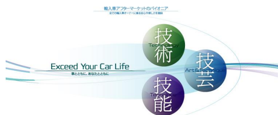
YASの企業使命イメージ

YASが企業使命として掲げる「技術、技能、技芸」の三技の向上に務めて、今後共、高品質な作業を拠点の皆様へご提供できるよう努めて参ります。