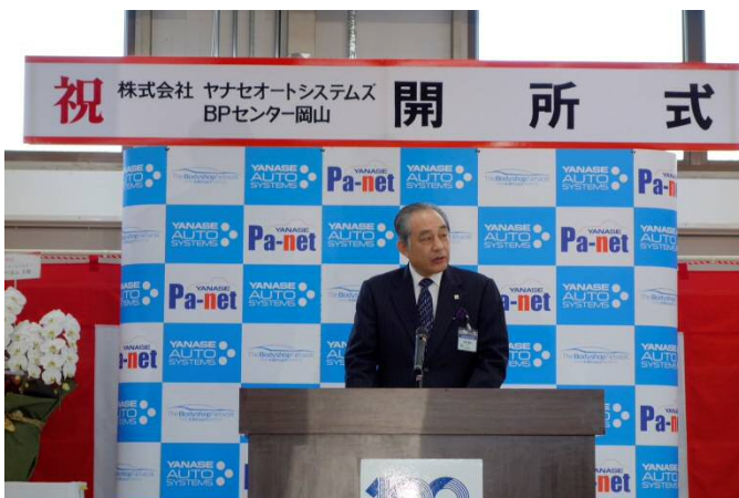
【木田社長からのご挨拶】